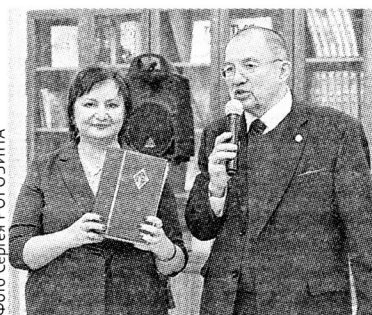
Редакция передала Нацбиблиотеке УР том БСЭ об СССР.